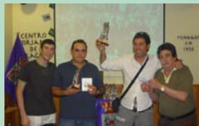
Algunos de los vencedores del campeonato de mus.