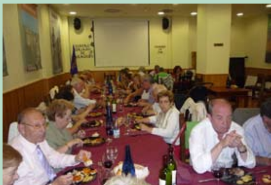
Un momento de la comida sanjuanera.