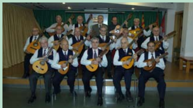
Imagen de la Rondalla San Saturio.