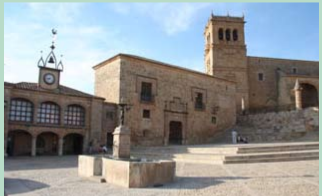
Plaza de la localidad soriana de Morón de Almazán.

Su tarea como presidenta de la Juventud será la de coordinar a las juventudes de todas las Casas Regionales de Castilla y León de Argentina, no sólo de Buenos Aires, y también la referente de los jóvenes ante la Junta de Castilla y León, a través de la Dirección de Políticas Migratorias.